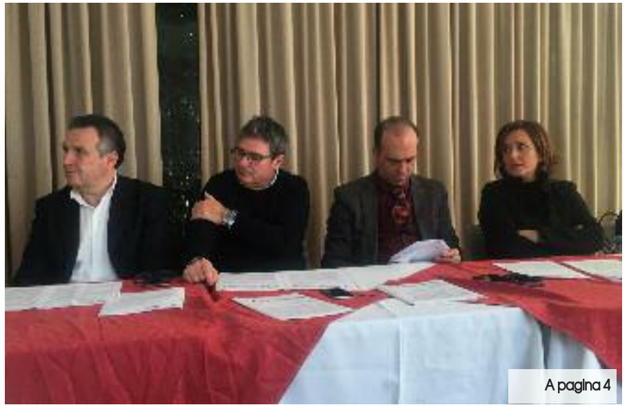
A pagina 4